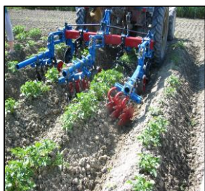
Sarcleuse à étoiles

Roulements à doubles palets, étanche, roulements à lubrifier