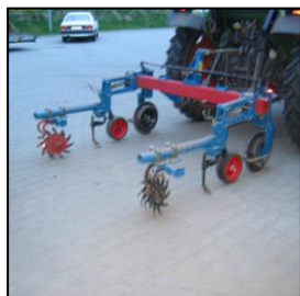
Sarcleuse à étoiles pour ameublir les rangs

Outils dirigés en parallélogramme avec dispositif pour ameublir le sol 2 étoiles sur bordure de planches