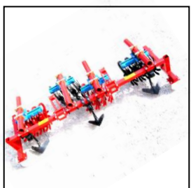
Sarcleuse à étoiles pour modèle porte outil Fendt 231 pour culture du maïs Construction rigide spéciale des portes outils avec dispositif spécial pour ameublir le sol 8 étoiles par rang