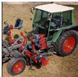
Sarcleuse à étoiles, 4 rangées pour modèle porte outil Fendt 275, culture des fraises Porte-outils à ressort avec disques coupants pour ramifications 10 étoiles par rang

Montage arrière 2 rangs pour culture de pommes de terre Outils déployés en parallélogramme pour ameublir le sol, fonctionnant comme herse étrille, auto-commande mécanique 4 étoiles par rang