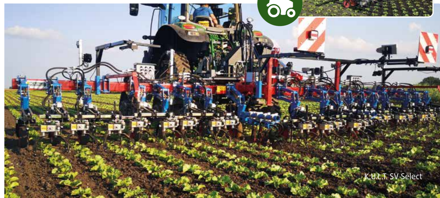
K.U.L.T. SV Select