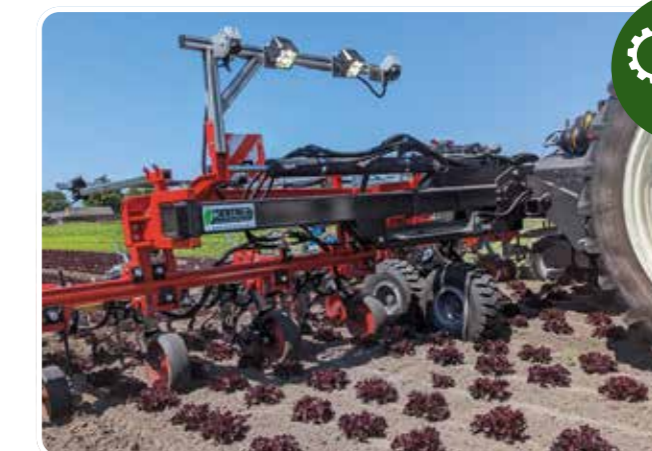
K.U.L.T. Tripple Select